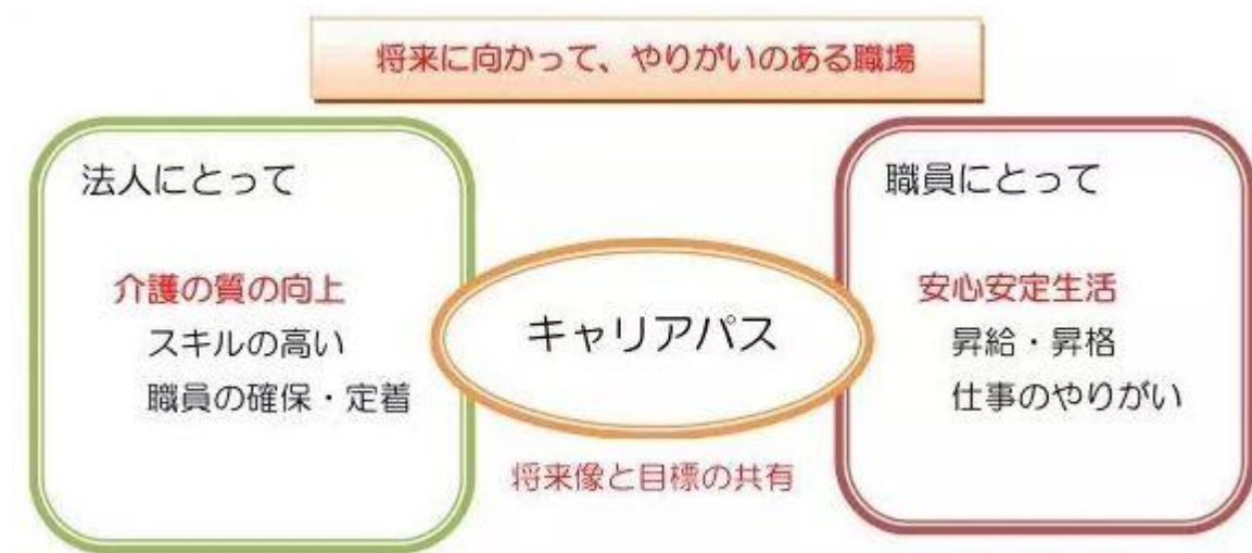
公益社団法人 全国老人福祉施設協議会のキャリアパスガイドライン（素案）

それでは、法人・施設は下図の「将来に向かって、やりがいのある職場」に向かっていますでしょうか？